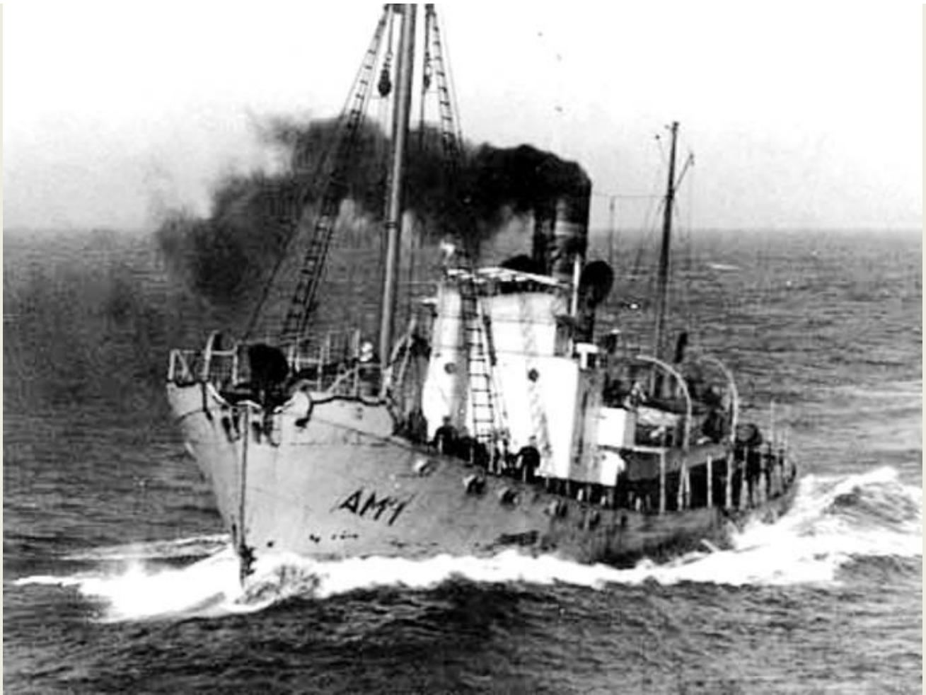
SFJ00319250420001 DS/Hvb FJORD.