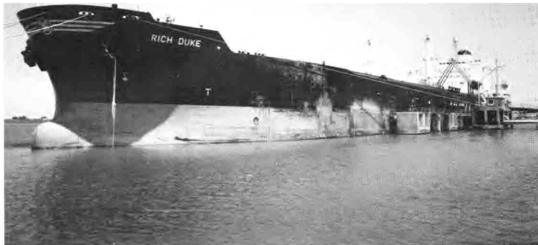
«Rich Duke» under lossing ved Champleirs anlegg i Corpus Christi.