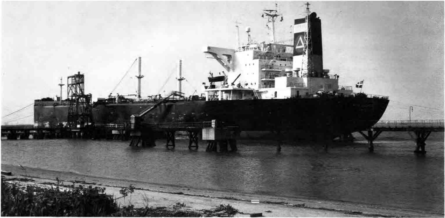
«Rich Duchess» under lossing ved Texacos anlegg i Delaware City.