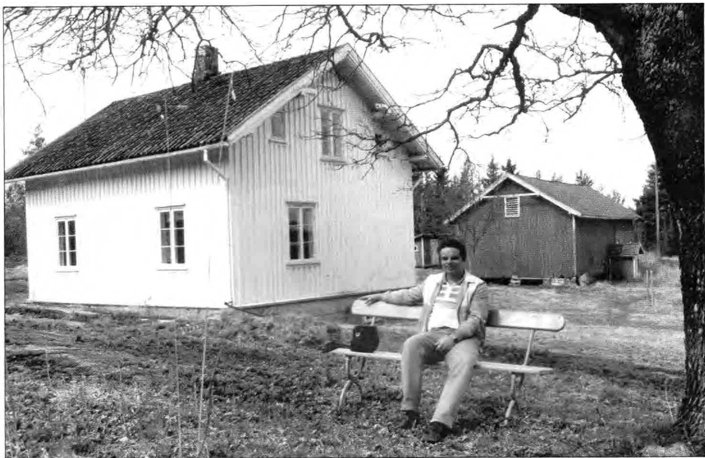
Lille Seljevik - en idyll hvor Saugbrugsansatte kan hente nye krefter.

Radio Halden benyttet anledningen til å lage et program om jubelanten der både tidligere og nåværende medlemmer ble intervjuet. Programmet varte i en time og ble sendt både før og etter jubileumsfesten.