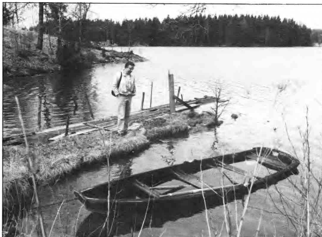
Et steinkast fra gården er det gode muligheter til å anlegge en brygge. Fiskemulighetene i Femsjøen er meget gode, og det er mye abbor å få for den som har fiskelykke.

Idrettslagets jubileum gikk altså ikke ubemerket hen. På jubileumsfesten var mange av de tidligere formenn til stede, og beretningen som var laget i anledning dagen, bar bud om et idrettslag i kraftig medvind og med en bredde både når det gjelder aktiviteter og medlemmer - som må imponere.