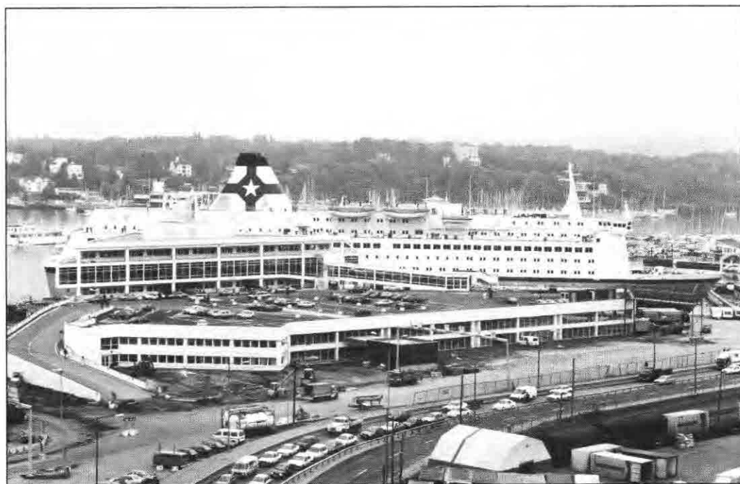
Avviklingen av trafikken, både når det gjelder passasjerer og biler, fungerer nå mye bedre.

Den uthengde passasjerhallen med skråstagen og den skarpe trekantformen er ment å spille opp mot skipets linjer, sier Thorenfeldt.