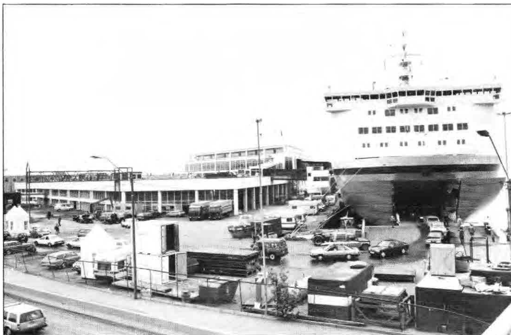
Terminalen og «Kronprins Harald» fotografert fra landsiden.

Et øvre kaiplan for tilbringertjenesten til terminalen (busser, drosjer, biler, fotgjengere), og et nedre kaiplan for vognto