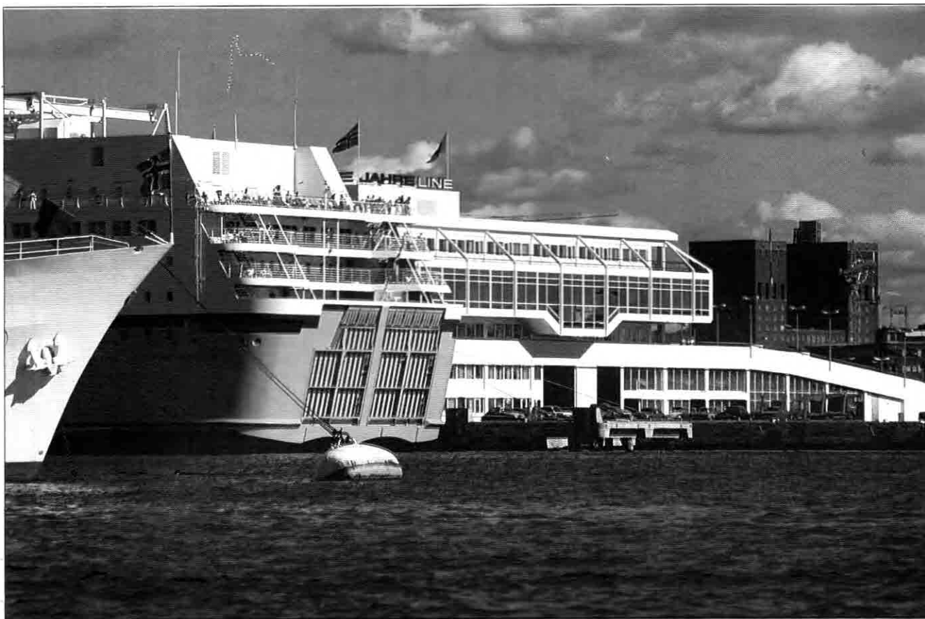
Den nye terminalen, som her sees mellom Kongeskipet, «Kronprins Harald» og Oslo Rådhus, tar seg godt ut.