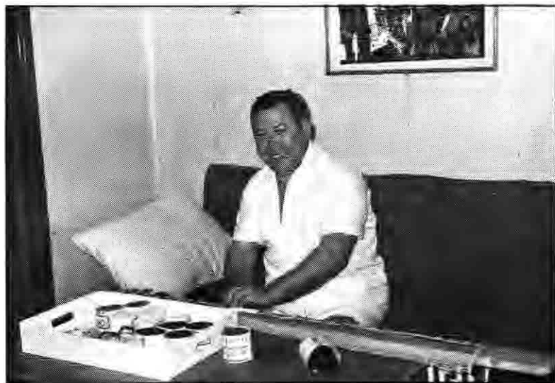
I esken ligger materialet han bruker .....