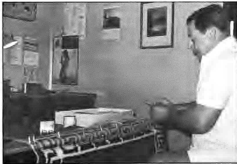
og her er han i full sving med sin hobby.