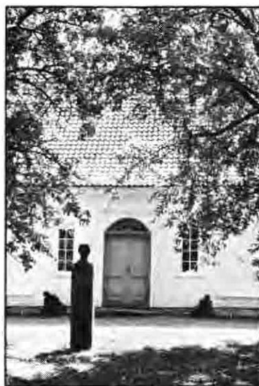
Bymuseets hovedinngang, med busten av Anders Jahre i forgrunnen.

at den årlige renteavkastning skal brukes til Innkjøp av gjenstander til museets samlinger og til kulturarbeide som er knyttet til museet. Det var forøvrig Anders Jahre selv som la grunnlaget for Sandefjord By-museum da han i 1952 skjen-