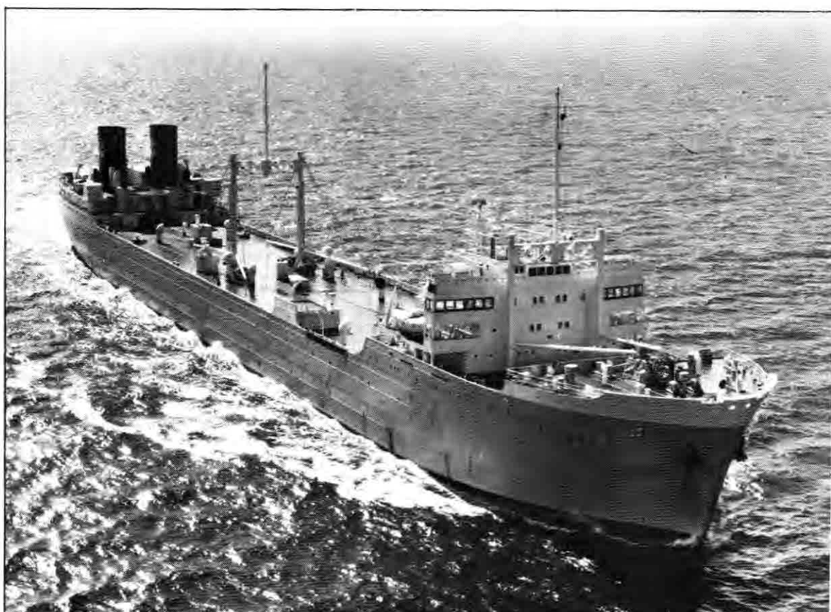
«KOSMOS V» var bygd som hvalkokeri i England og gikk sin første tur til fangstfeltet I desember 1948 som transportskip. Ingen visste den gang at ((KOSMOS V» aldri skulle komme til å gjøre tjeneste som hvalkokeri.

Men dermed lot det til at motorene hadde bestemt seg for å bli mer medgjørige. Og allere.