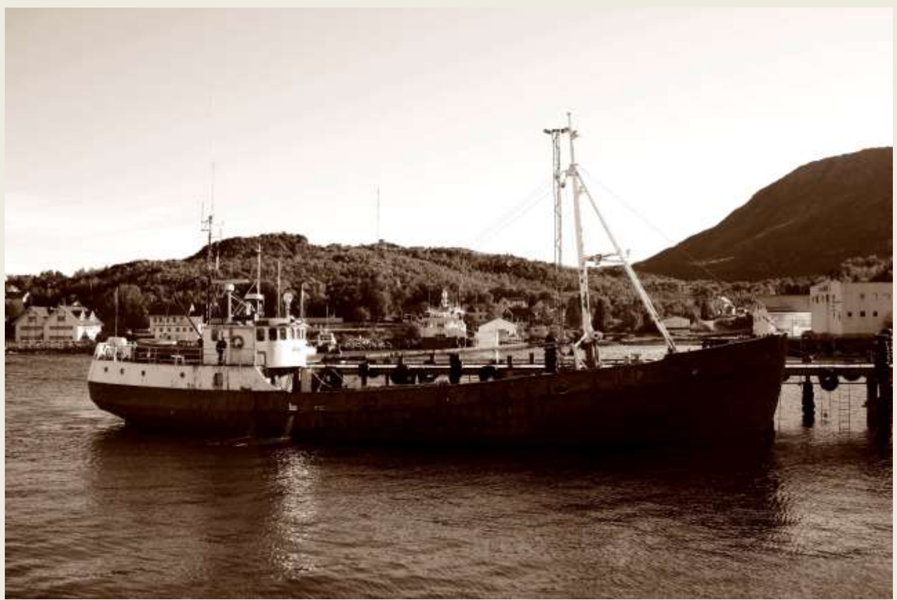
MAG91119120120004 DS/Hvb ALMIRANTE GONI som VESLEGUT i fraktesfartøyets drakt.