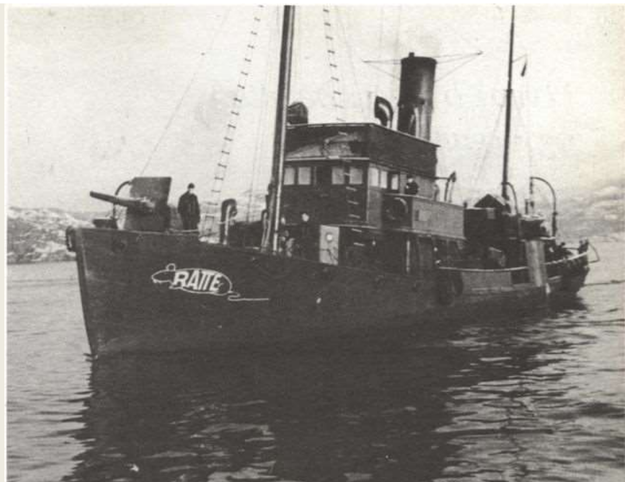
MAG91119120120002 DS/Hvb ALMIRANTE GONI som RATTE i tysk krigstjeneste.